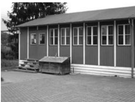
Treffpunkt für Jung und Alt: Baracke Auzelg

Dann gibt es da noch die aufsuchende Jugendarbeit, die oft von der Umgebung der „störenden“ Jugendlichen falsch aufgefasst wird. Sie ist nämlich nicht da, um die Konflikte zwischen den Jugendlichen und der Umgebung abzunehmen und für Ruhe und Ordnung zu sorgen, sondern um auf die Bedürfnisse der Jugendlichen einzugehen und ihnen bei der Bewältigung der Probleme beizustehen. Sie ist da, um vor allem jungen Menschen, die man anders nicht erreichen kann, aufzusuchen und mit ihnen zu reden. Es ist wichtig, solche falschen Erwartungen von der Umgebung bzw. Erwachsenen anzusprechen.